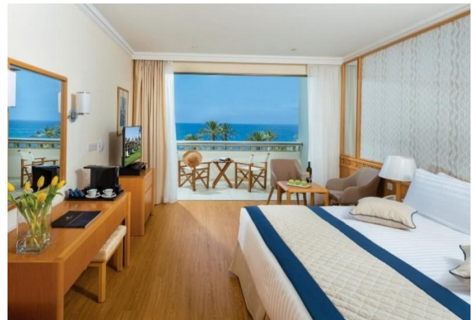
Constantinou Bros Athena Beach Hotel

Eine Bushaltestelle befindet sich direkt vor dem Hotel, und Taxis stehen jederzeit zur Verfügung.