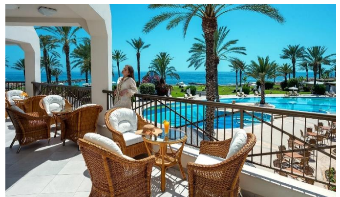
Constantinou Bros Athena Beach Hotel