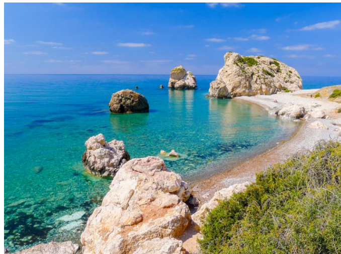
Felsen der Aphrodite